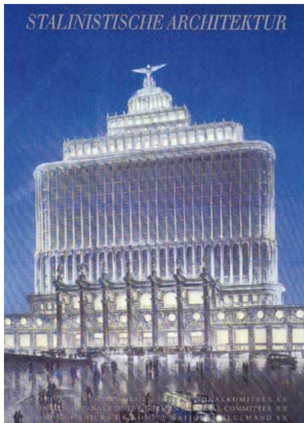
12. Okładka opracowania ICOMOS "Listing Stalinist Architecture?" (Berlin 1995/96).