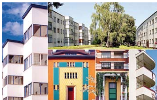
3. Berlin - modernistyczne osiedla mieszkaniowe. Ilustracja przedstawiająca 6 osiedli uznanych za światowe dziedzictwo XX wieku.

W 1998 r. Stała Konferencja niemieckich ministrów kultury skierowała do Ministerstwa Spraw Zagranicznych wnioski o zgłoszenie berlińskich zespołów mieszkaniowych do Centrum Światowego Dziedzictwa