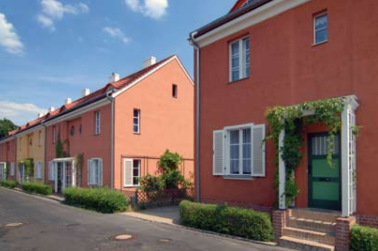
4. Domy osiedla-ogrodu Falkenberg zaprojektowane przez Bruno Tauta.

UNESCO w Paryżu w celu umieszczenia ich na tzw. Liście Informacyjnej jako niemieckich zabytków XX w. Republika Federalna Niemiec przedłożyła wniosek Centrum Światowego Dziedzictwa w przewidzianym regulaminem terminie w styczniu 2006 r. Następnie przeprowadzono niezbędne konsultacje, a eksperci z UNESCO oraz z ICOMOS sporządzili odpowiednie raporty. Wpis sześciu modernistycznych zespołów mieszkaniowych Berlina nastąpił w oparciu o dwa spośród sześciu kryteriów określonych przez wytyczne operacyjne do Konwencji Światowego Dziedzictwa, a mianowicie: