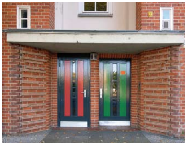
5. Wejścia na osiedlu Schillerpark, nazywanego Osiedlem Holenderskim, ze względu na ceglane elewacje, proj. Bruno Taut.

Zaprojektowane przez Bruno Tauta osiedle Schillerpark przeznaczono dla ok. 740 mieszkańców