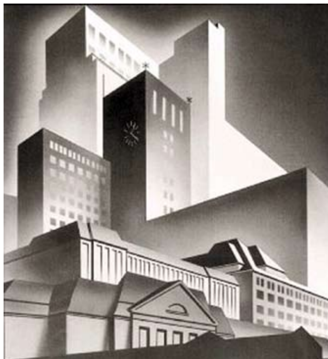
2. Metropolis – Elektropolis: ilustracja - Collage z budynków osiedla Siemensstadt – po I wojnie światowej stolica Niemiec stała się synonimem miasta wiodącego w przemyśle i kulturze modernizmu.

Zespoły mieszkaniowe zbudowane w latach 20. XX w. zyskały wysokie uznanie nie tylko wśród współczesnych, chwalono je również w następnych dekadach. Znaczenie tych zabytków architektury docenili zarówno ich właściciele i użytkownicy, jak też architekci oraz politycy, dzięki czemu większość osiedli była przez lata otoczona staranną opieką, jeszcze zanim objęto je oficjalną ochroną konserwatorską. W efekcie większość z tych obiektów zachowała się do dziś w wyjątkowo dobrym stanie. Dodatkowo NRD-owska ustawa o ochronie zabytków (1975) oraz Ustawa o konserwacji zabytków w Berlinie Zachodnim (1977) dały władzom konserwatorskim po obu stronach żelaznej kurtyny nowe uprawnienia, które wykorzystano w celu ochrony najważniejszych modernistycznych zabytków budownictwa socjalnego okresu międzywojennego. Po obaleniu muru berlińskiego uchwalono nowe, wspólne ustawy (np. Ustawa o harmonizacji