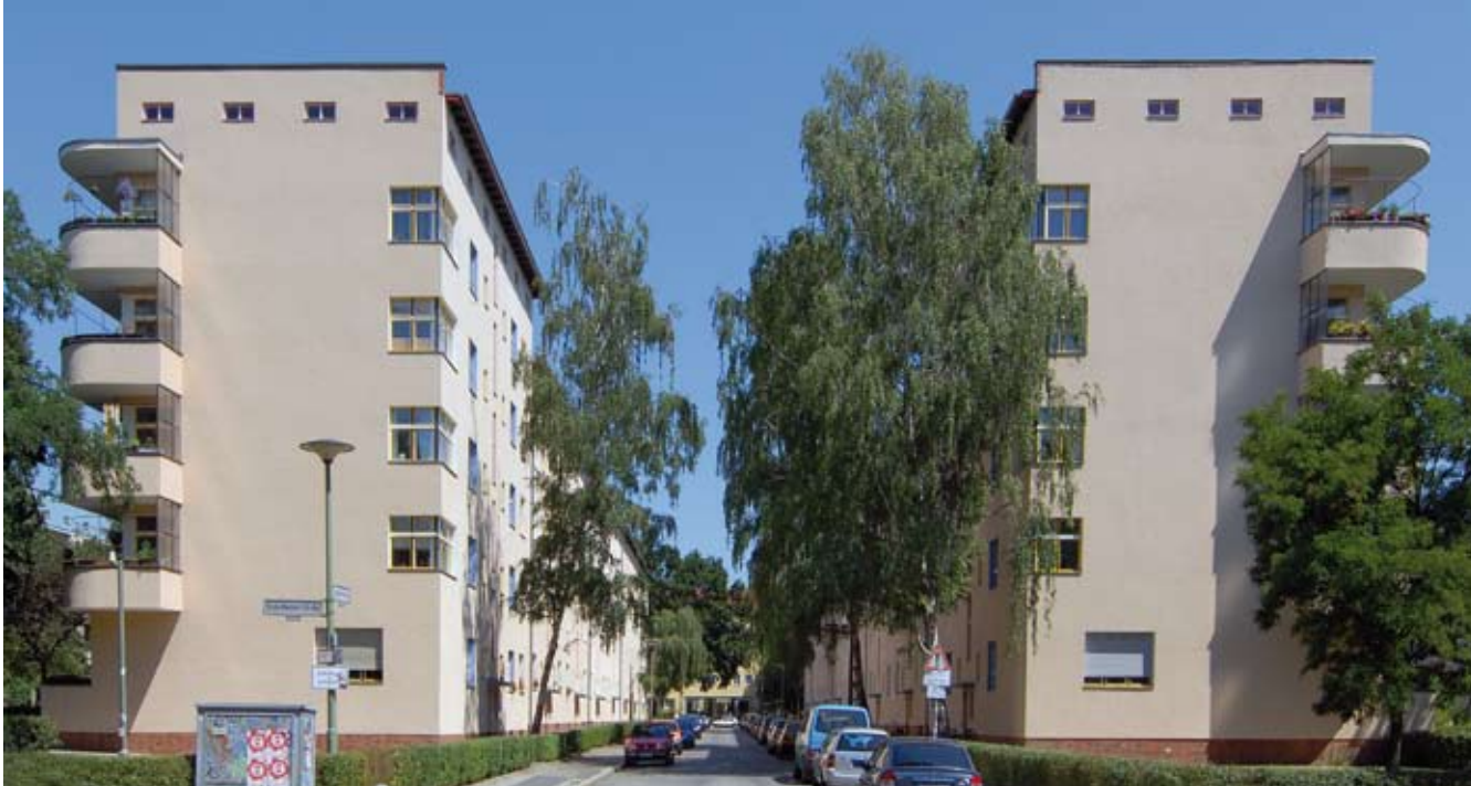
7. Narożny budynek rzędu pięciokondygnacyjnych budynków osiedla Carl Legien projektu Bruno Tauta.