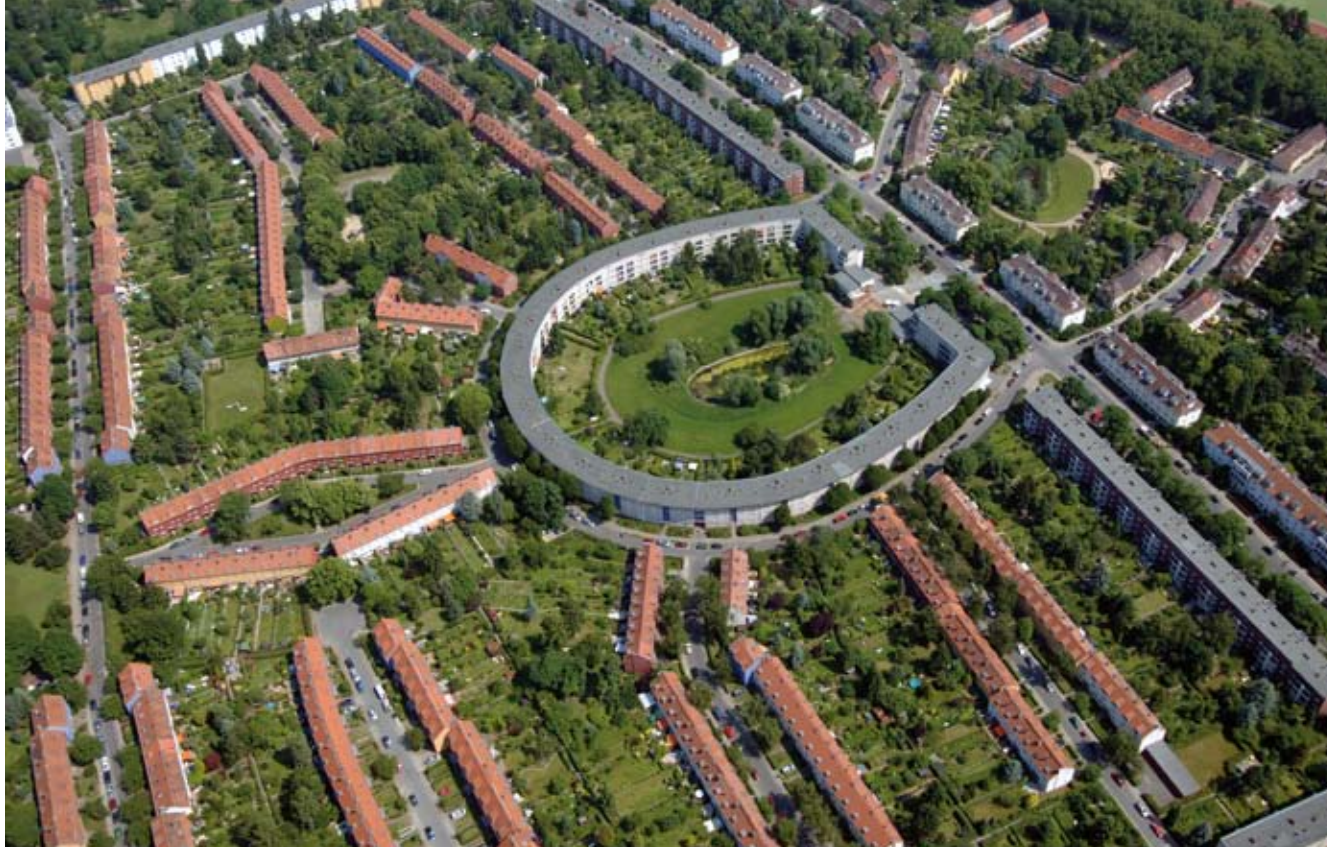
6b. Widok lotniczy w 2005 r. założenia mieszkalnego osiedla Britz, nazywanego Hufeisensiedlung (osiedle „Podkowa”), proj. Bruno Taut.

W koncepcji osiedla „Podkowa” Tautowi udało się na wielką skalę zrealizować swoją wizję otwartego projektu urbanistycznego z dużą ilością zieleni. W równym stopniu zaspokojone zostało tu artystyczne pragnienie nowoczesności i funkcjonalności oraz społeczne zapotrzebowanie na światło, powietrze i słońce. Dzięki osiedlu „Podkowa” Bruno Taut, Martin Wagner i Leberecht Migge zyskali reputację architektów reform społecznych i urbanistów lat 20. XX wieku.