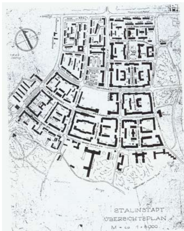
14. Plan urbanistyczny socjalistycznego miasta „Stalinstadt” (Miasto Stalina) w pobliżu Fürstenberg (Niemcy), później nazwanego „Eisenhüttenstadt” („Miasto hut żelaza”) z lat 1957-58.

Przykłady z Polski i Niemiec, takie jak Pałac Kultury i Nauki im. Józefa Stalina w Warszawie, budynek Ambasady Radzieckiej i dawna Aleja Stalina w Berlinie czy dzielnice przemysłowe takie jak Nowa Huta albo Eisenhüttenstadt , mogą stanowić jedynie pars pro toto , paradygmatyczną część całości, która przypomina nam o tym, co działo się w Europie na przestrzeni minionego wieku, a jest to zarówno modernizm, jak i nurt przeciwny - postmodernizm. Nasze dwudziestowieczne dziedzictwo stanowią nie tylko niewątpli-