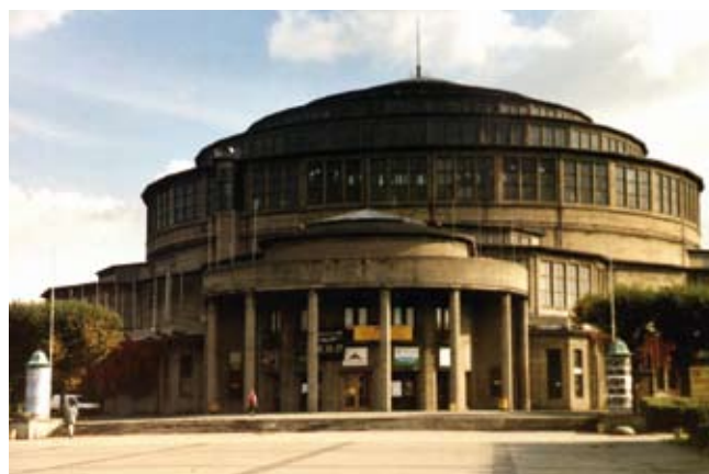
11. Hala Stulecia (Ludowa) we Wrocławiu (1911-13) zaprojektowana przez Maxa Berga, przykład wczesnego modernizmu znajdujący się w Polsce, wpisana na Listę Światowego Dziedzictwa UNESCO w 2006 r.