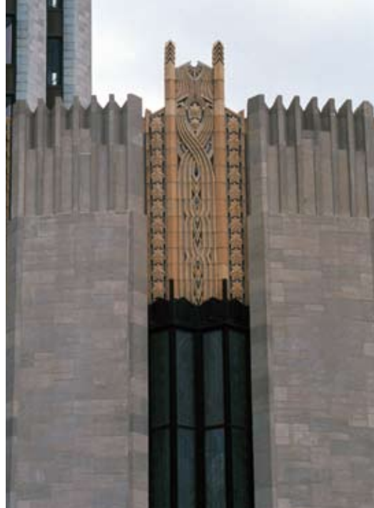
8. Tulsa, The Boston Avenue Methodist Church, dekoracja symbolizująca rozchodzenie się bożej miłości. Gwiazdy symbolizują 7 cnót głównych