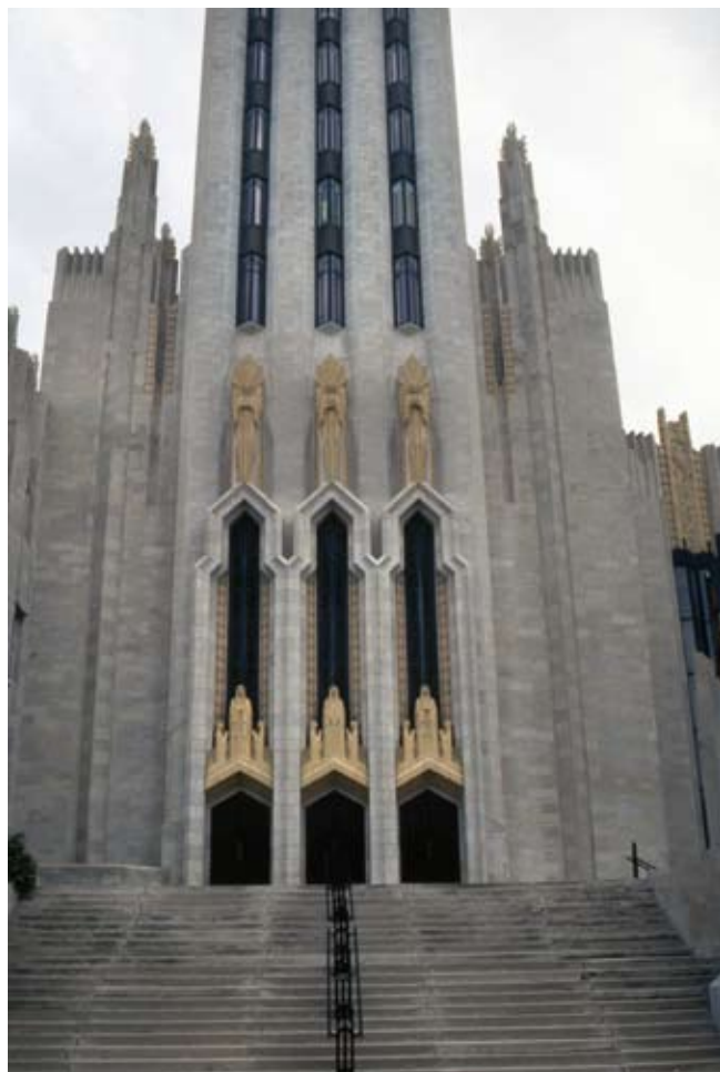
4. Tulsa, The Boston Avenue United Methodist Church, elewacja wejściowa od strony północnej