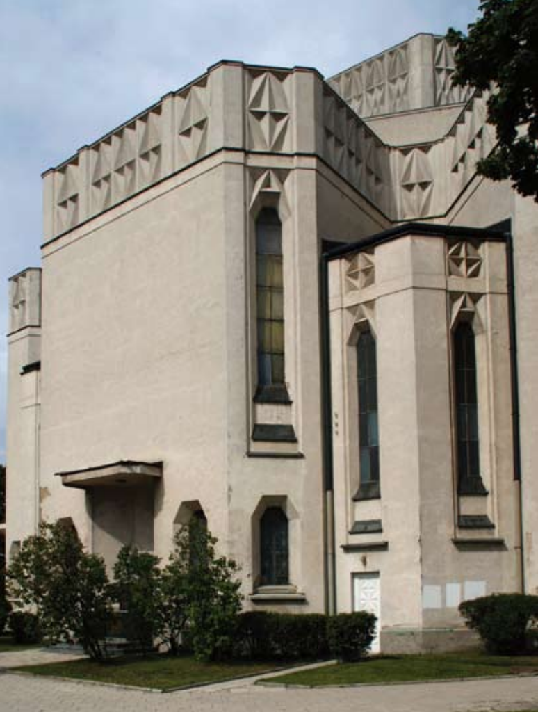
5. Białystok, kościół św. Rocha, fragment bryły