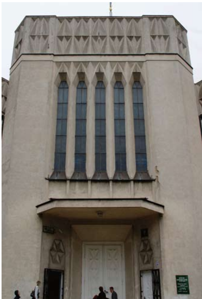
3. Białystok, kościół św. Rocha, wejście główne