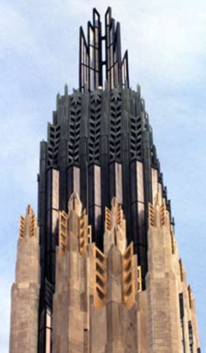
7. Tulsa, The Boston Avenue Methodist Church, fragment wieży