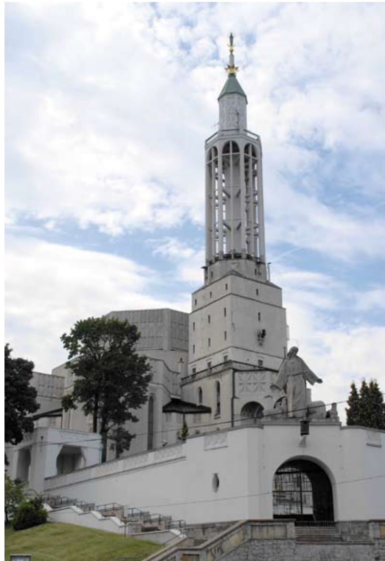
1. Oskar Sosnowski, kościół św. Rocha, Białystok 1926 - 1938 - 1961

Kościół w Białymstoku został zasadniczo ukończony w stanie surowym w 1938 r., lecz prace przy