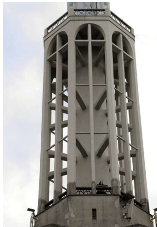
6. Białystok, kościół św. Rocha, fragment wieży