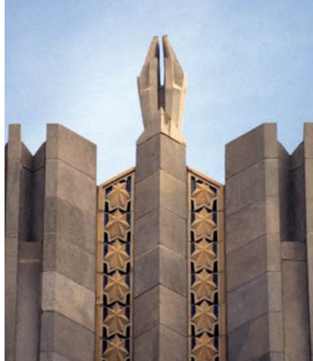
9. Tulsa, The Boston Avenue Methodist Church, sterczyna w kształcie rąk złożonych do modlitwy

nego wezwania świątyni, którym miała być Gwiazda Zaranna, Jutrzenka Niepodległości. Architektoniczno – plastycznym odzwierciedleniem tej idei są: plan w kształcie gwiazdy, gwiazdzisto – kryształkowe motywy zdobiące attyki, stropy, dachy, zwieńczenia okien. Kulminacją jest wieńcząca wieżę figura Matki Boskiej, jako Królowej Korony Polskiej. Stoi ona na sierpie księżycy, jako Gwiazda Zaranna. Niżej umieszczona korona jest wzorowana na wawelskiej Kazimierza Wielkiego. Centralny plan kościoła odbija ład wszechświata, idealnym światem jest chrześcijaństwo, które tworzą ludzie przychodzący do kościoła. Ze szklanej kopuły z wyobrażeniem Gołębicy i symbolami Czterech Ewangelistów spływają boskie promienie na wiernych.