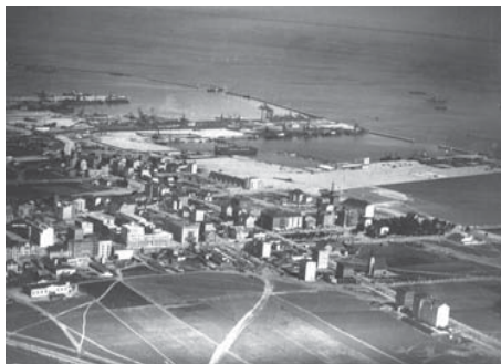
Widok portu i miasta w 1933 r.

Pierwsza informacja o istnieniu wsi Gdynia pochodzi z roku 1253. Przez stulecia była to jedna z wielu osad położonych nad Zatoką Gdańską. Mieszkańcy zajmowali się rybołówstwem i uprawą roli. Na początku XX wieku rosnąca popularność wypoczynku nad morzem sprawiła, że Gdynia zaczęła przekształcać się w miejscowość letniskową. Nad brzegiem morza powstał dom kuracjiny i urządzono kąpielisko, a w wielu domach były pokoje dla letników.