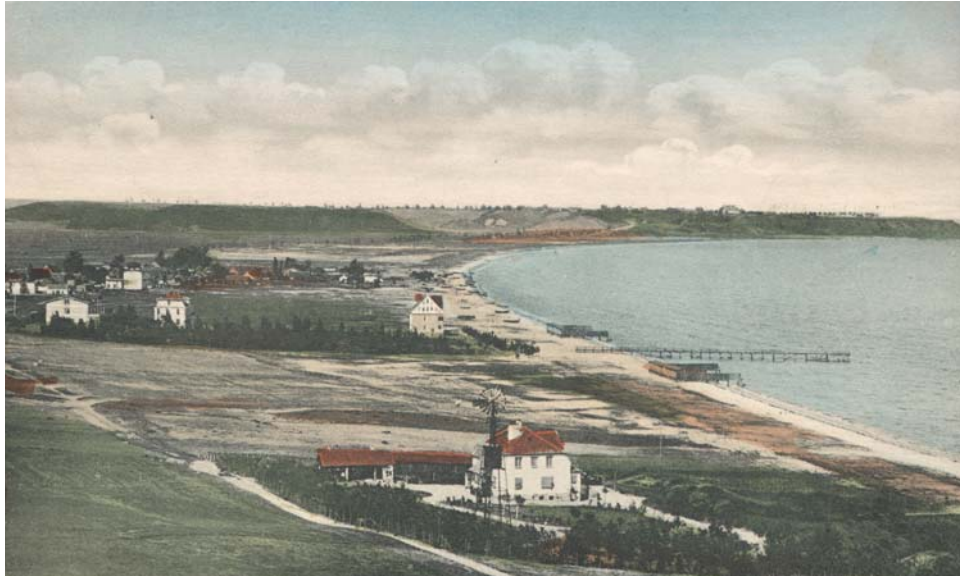
Widok wsi i letniska w 1913 r.